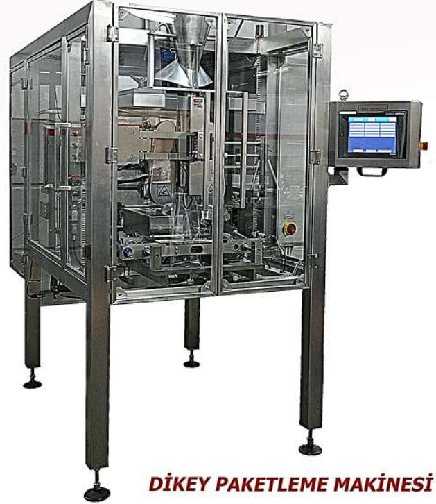
DİKEY PAKETLEME MAKİNESİ